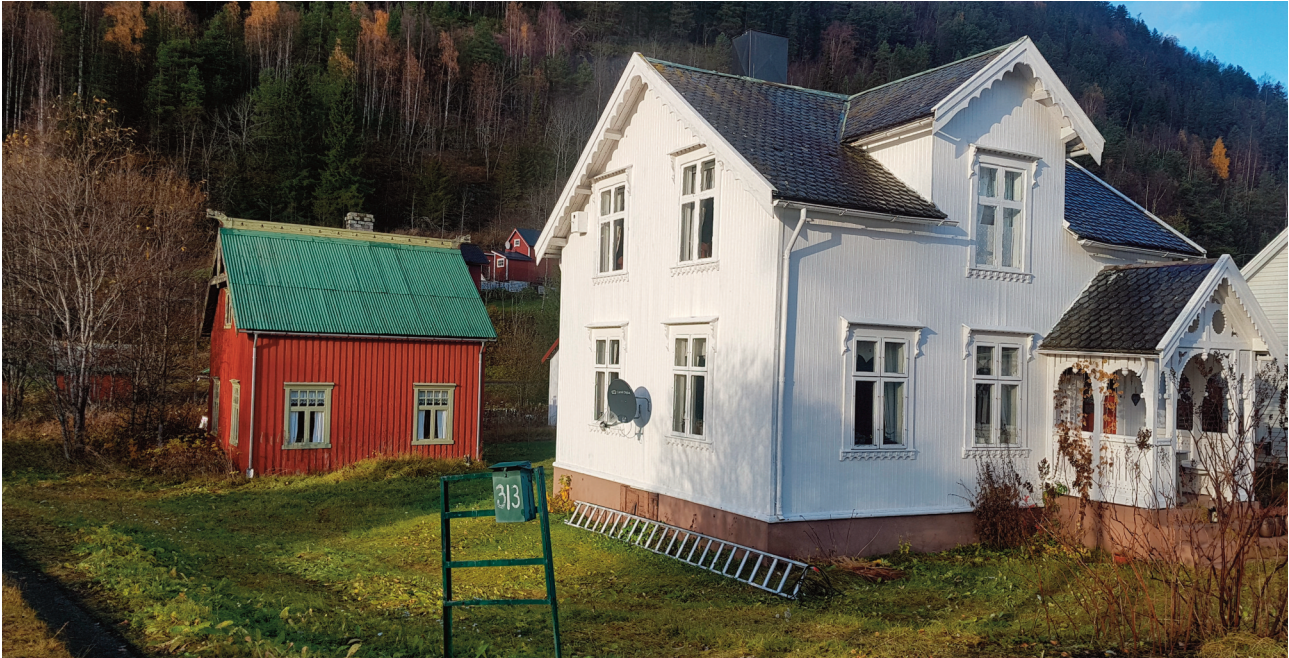
Boligen er ett av de fineste eksemplene på den rike boligarkitekturen.