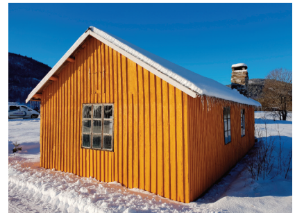
Båtskytte og eldhus i Nordnes.

Fra slutten av 1800-tallet ble det bygd mange skogshusvær og de første