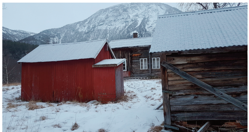
Bolig, fjøs og sjå på husmannsplassen i Botnvatn.

Gammen er bygd av nordsamene som begynte å bruke beiteområdene på Saltfjellet etter 1920. Gammen har