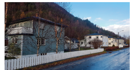
Den nordre delen av Dalvegen.

Bolighuset er av typen nordlandshus, med skifertaket, panelet og vinduene bevart. Boligen danner den visuelle avslutningen av Tyrivegen når man kommer østfra, og har en viktig miljøskapende funksjon.