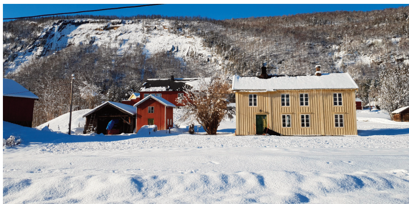
Fjøs, båtskytte, stabbur, bolighus.

Gårdsvegene på Røkland er for en stor del bevart og de er et viktig trekk ved gården. Sørøver på bnr 1 går det en gammel ferdselsveg mellom våningshuset og eldhuset, den minner om en alderdommelig hulveg. Kulturlandskapet er fortsatt velpleid, og det er viktig å sikre omgivelsene til og forbindelsene mellom de bevaringsverdige bygningsmiljøene.