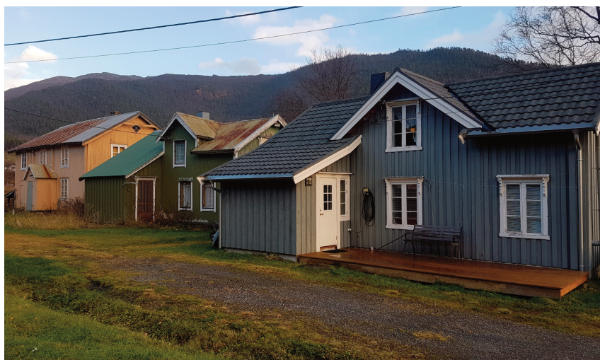
Bolighus i rekke i Ytre Saksenvik. Typiske for perioden etter utskiftingen av klyngetunet.

Bolighus Bolighuset er av de best bevarte i Saksenvik, Det har en tradisjonell form, med en tømret kjerne og med sval bygd i reisverk mot nordøst. Svala er kledd i en grovere tømmermannskledning, for å markere at det er uthus. Bygningen står i rekke med to andre bolighus og har stor miljøskapende verdi.