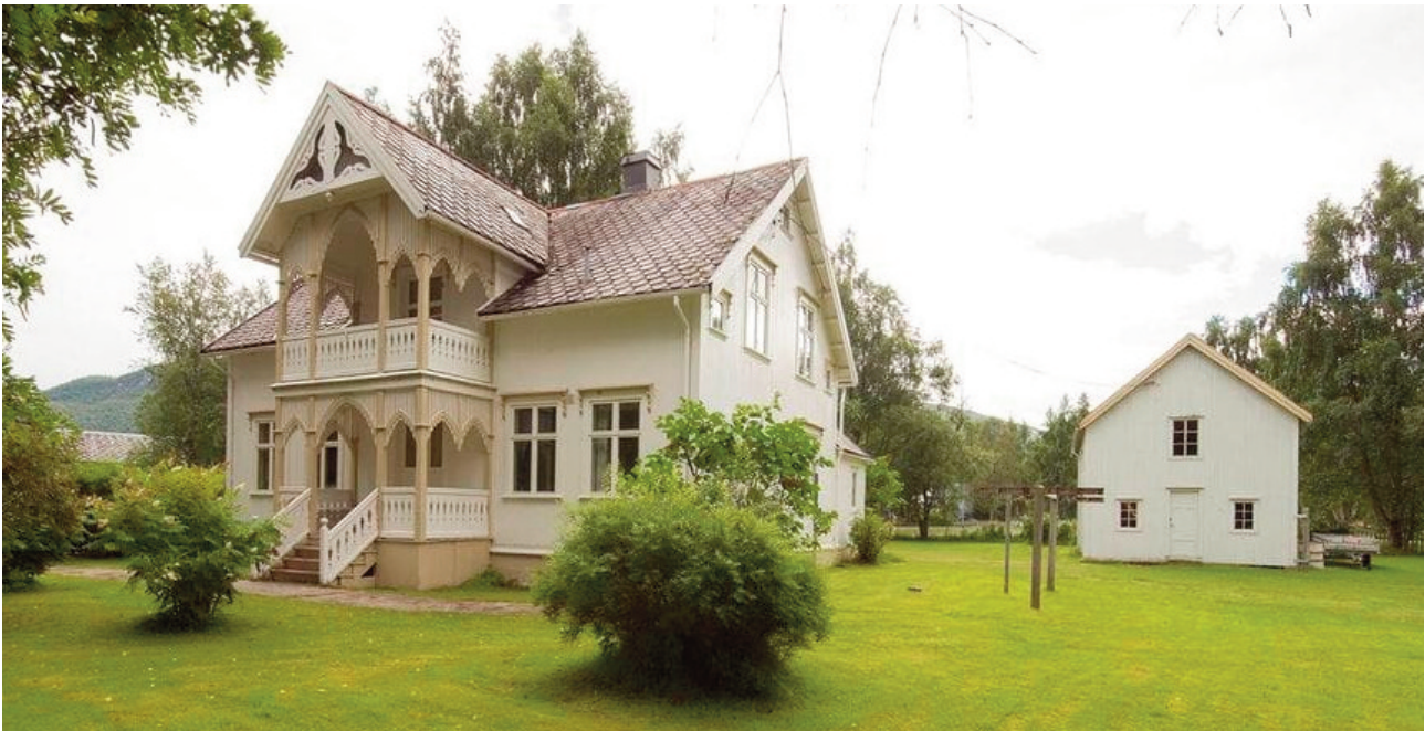
Kranegården, eksempel på Saltdals rike boligarkitektur.