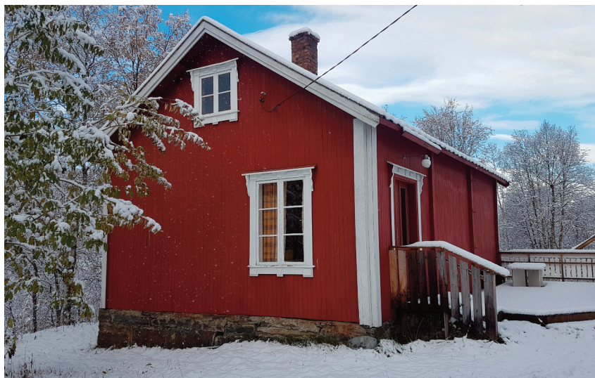
Skolehuset i Evenesdal er i bruk som grendehus.

Røklandsmoen. Støttene ved Krokelva og Bjørnelva ble sprengt i 1950, i seg selv en sterk historie om etterkrigstida. Minnestøttene har høy kulturminneverdi og det må sikres en forsvarlig forvaltning.