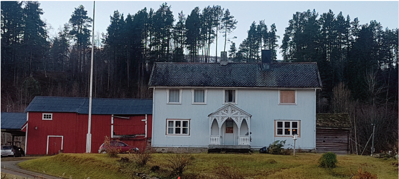
Oldgård på Drageid er et godt bevart gårdstun fra tidlig 1900-tall. Stabburet bak til høyre er bygd før 1650 og automatisk fredet.