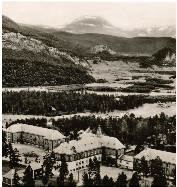
Eldre oversiktsbilde av Vensmoen.