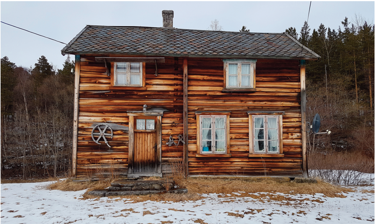
Bolighuset på Lifjell.