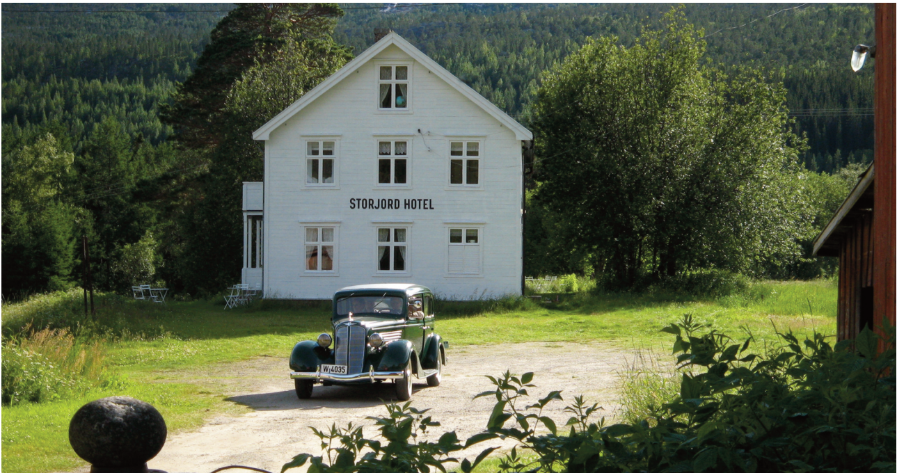
Det gamle trehotellet er varsomt restaurert.