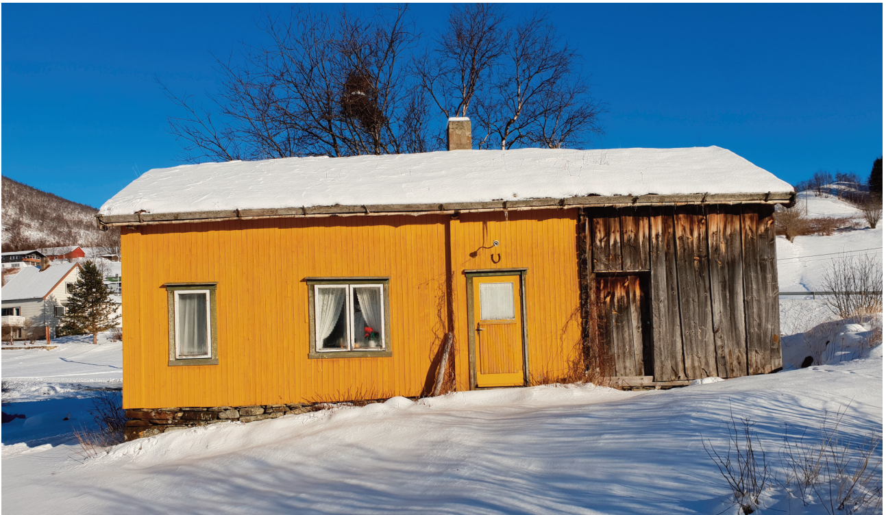
Bolighuset på Setså, ett av få i Saltdal bevart med grue.

eldste seterhuset bygd omkring 1870. Seterdrift var ikke vanlig i Salten, og Grønlietra er ett av få unntak vi kjenner.