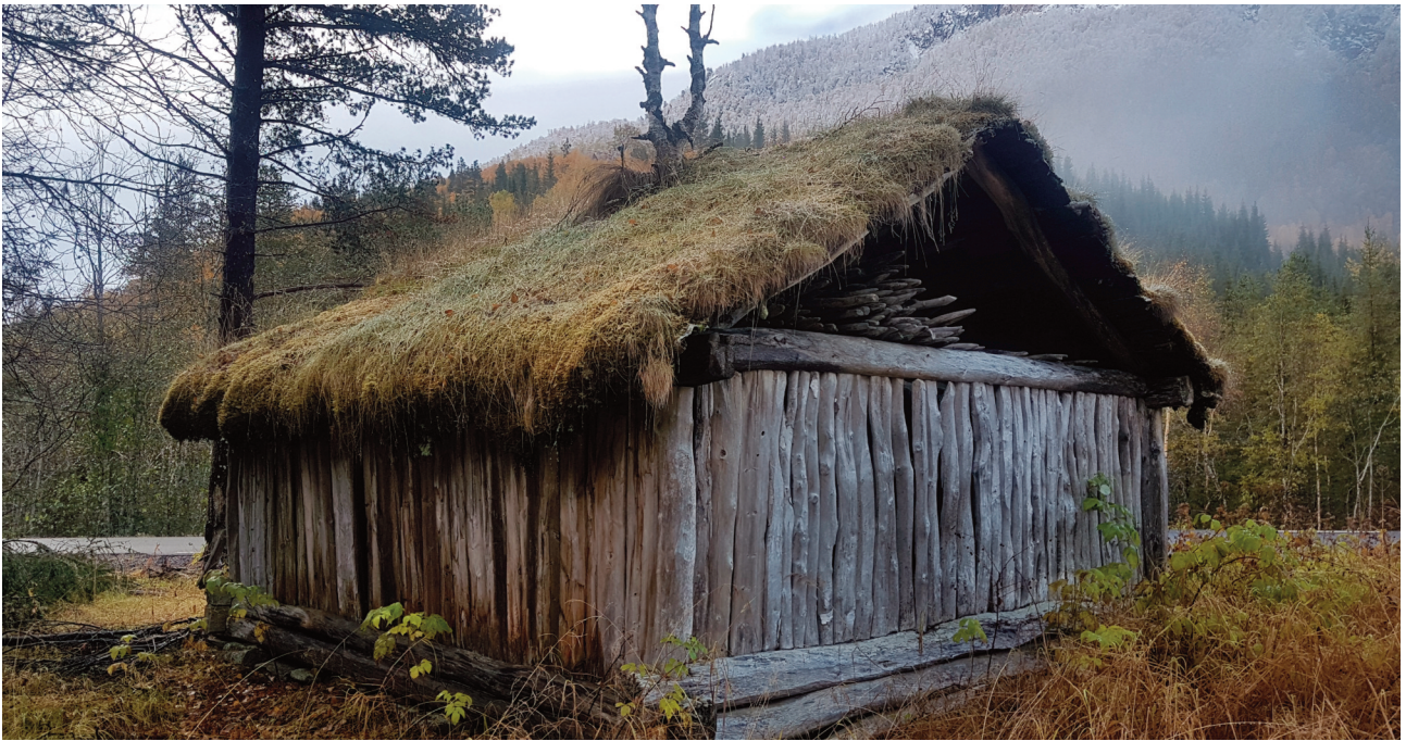
Høyskytte bygd i skjelverterk, på Evensgård.