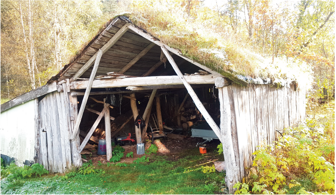
Båtskytta på Jobakkane i Storalmenningen er fra midten av 1800-tallet.

også innslag av pitesamisk byggeskikk. I området er også rester av reingjerde og mange andre kulturminner.