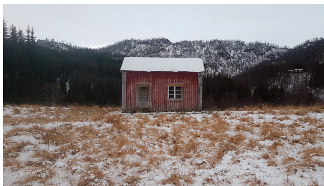
Det gamle bolighuset i Øvergården.

«Lappvegen» er en sti og hulveg som strekker seg fra Medby til Tverråmoen. Noen steder lett synlig, andre steder ødelagt av vegbygging. Navnet forteller om samisk bosetting og bruk av veggen. Veggen er antakelig veldig gammel, førreformatorisk og fredet. Lokalt på Tverråmoen er det fine gårdsveger, eldre og nyere skogsveger, og ferdsselsårer både mot Misvær, Skar, Sundby og Drageid.