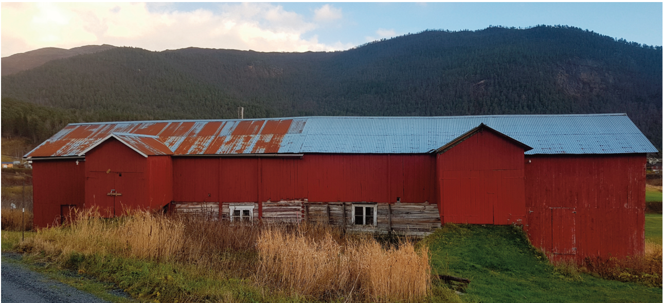
Det lange og lave fjøset bygd om lag i 1885 er satt opp for to brukere, og er innvendig adskilt.