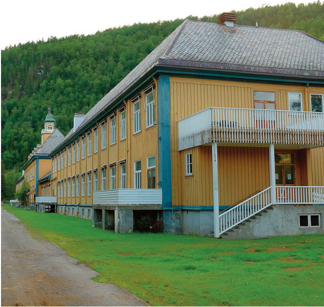
Hovedbygningen på Vensmoen.