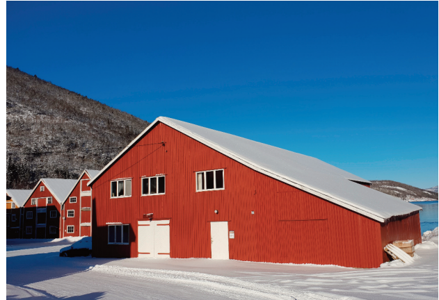
Hansennaustet, båtbyggerverksted fra etterkrigstida.