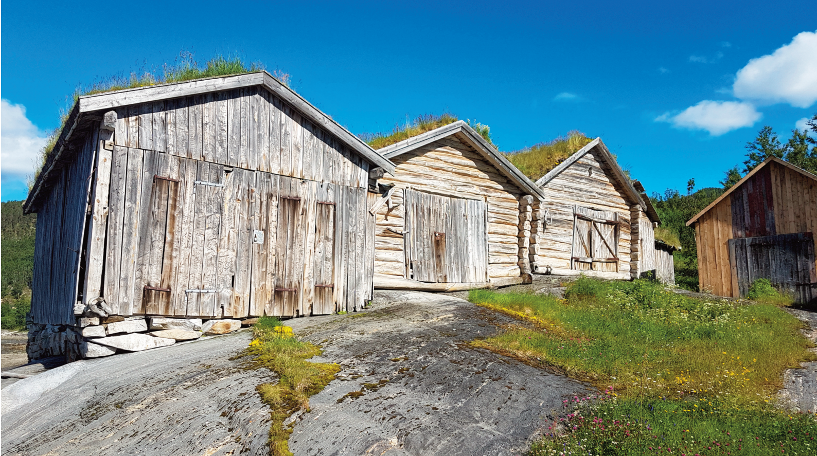
Naustklyngen i Saksenvik er et kjent og sjeldent kulturmiljø.