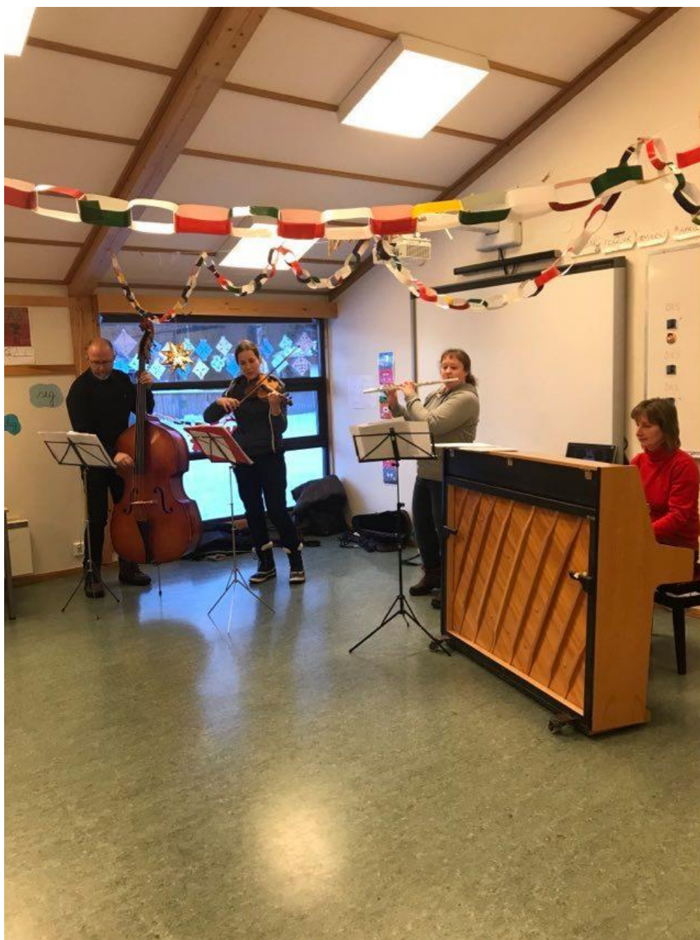
Kulturskolens ansatte. Tema: «Folkemusikk fra Saltdal» på 2. trinn.