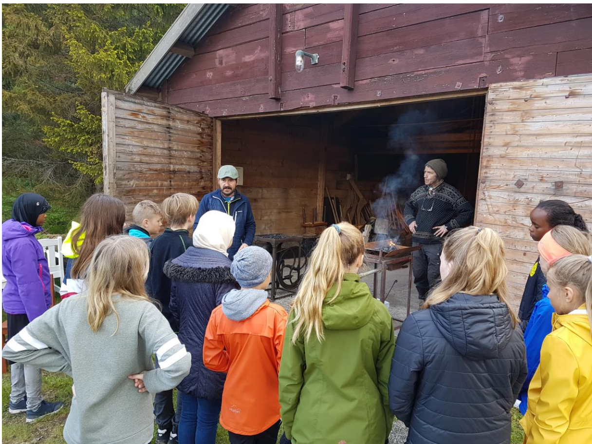
Elever på besøk hos Nordland museum, Tema: Kvernstein og kvernsteinsbruddet i Saksenvik.

Den kulturelle skolesekken (Dks) ble etablert i 2001, og i Saltdal kom arbeidet med Dks i gang i 2004.