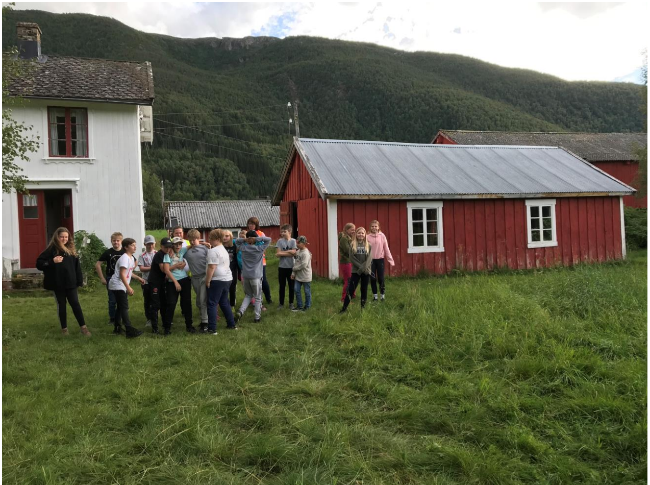
Elever på besøk på Gullbakkgården på Brenne.

Dks skal være med på å skape entusiasme i kulturbygda Saltdal, og bidra til å styrke den lokale tilhørigheten.