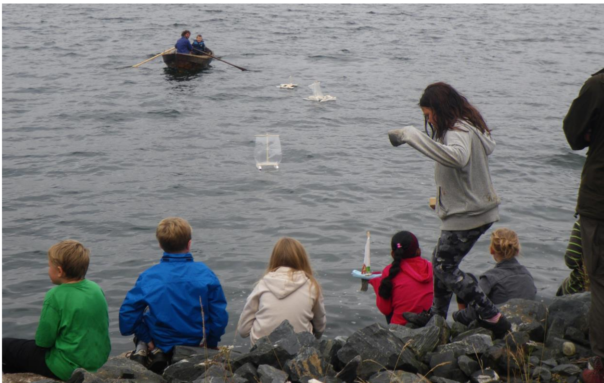
Prøveseiling i Rognanfjæra.