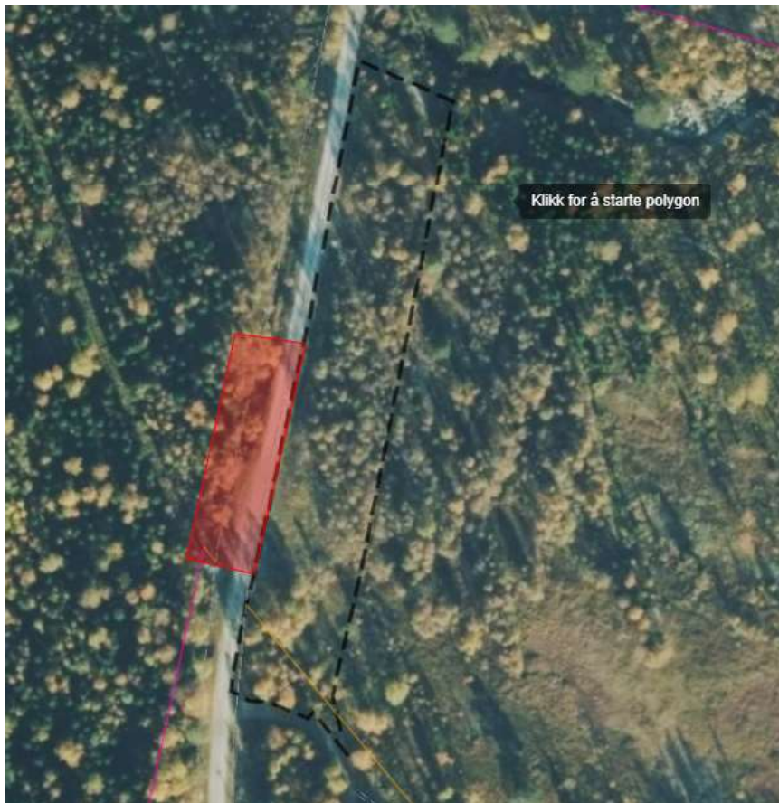
Figur 1 Utvidet område i vest

I tillegg til utvidelse endres planområdet slik at det har en bredde på ca. 15 meter. Dette sikrer parkering av biler med henger og snøopplager.